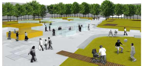
IMMAGINE 2 > piazza centrale con mercato