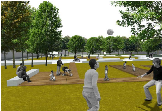
IMMAGINE 1 > vista su percorsi e soste